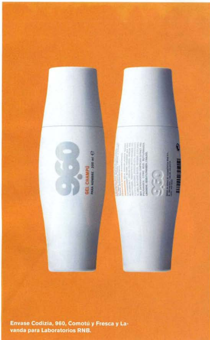
Envase Codizia, 960, Comotú y Fresca y Lavanda para Laboratorios RNB.