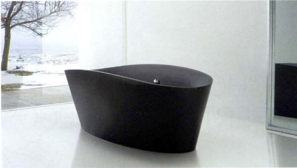
Bañera Tina, Colección de mobiliario de baño Neo, Grifo Metro y Accesorios para el baño Suma, de Sanico.